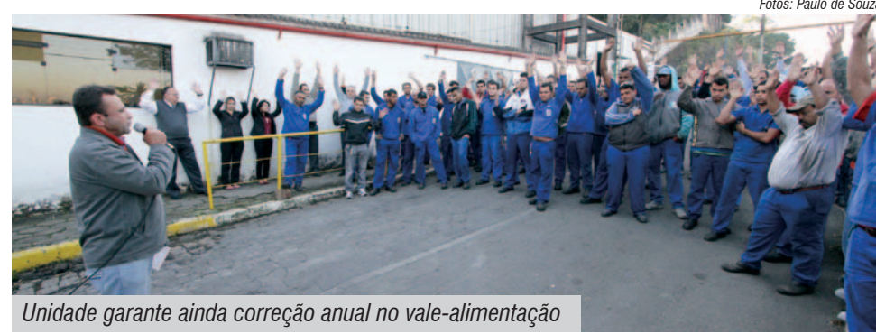
Unidade garante ainda correção anual no vale-alimentação

Outro avanço foi o aumento conquistado no vale-alimentação,