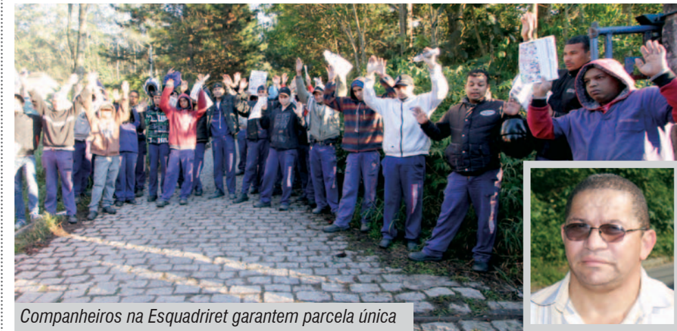
Companheiros na Esquadrinet garantem parcela única

Em assembleia na portaria da fábrica, os 50 trabalhadores na Esquadrinet, em Ribeirão Pires, aprovaram proposta de PLR na última quinta-feira.