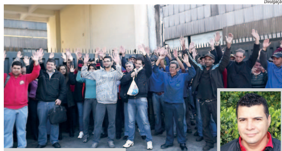
Trabalhadores em assembleia na Feba

"Todos vão com marmita, muitos moram longe e, às vezes, nem levam comida, tendo que comer fora da empresa. O restaurante é